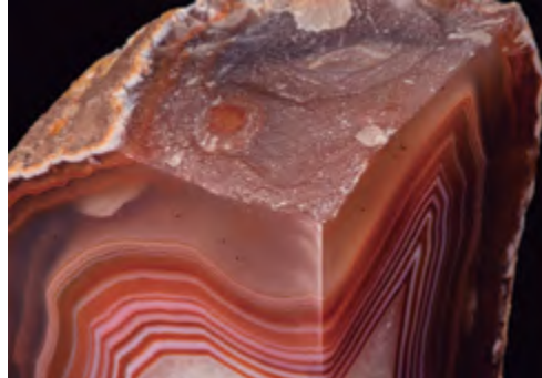
Ágata, la energía de equilibrio para los momentos de indecisión.

Piedras de los nacidos en julio y agosto