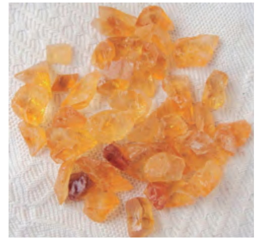
Citrino, símbolo del sol.

También se puede construir un pequeño mandala con estas piedras alrededor de una foto, para mo-