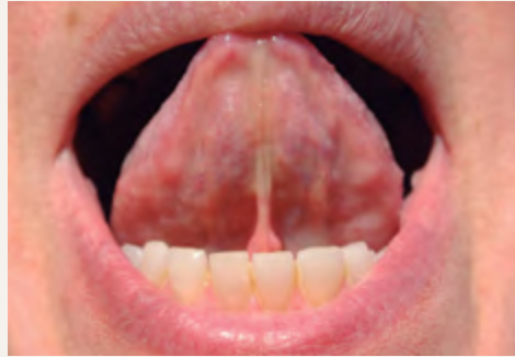
Mar Tarazona Colegiado N° 1794

La lengua, órgano medio musculoso, constituye un mapa de todas nuestras áreas del organismo y observándola podemos diagnosticar lo que está pasando a otros niveles. El entorpecimiento de la lengua nos indica que hay una falta de oxigenación en todo el cuerpo. Una lengua sucia y blanquecina nos señala que el estómago e intestinos están sobrecargados, cuando la lengua se vuelve lenta y torpe nos tiene que hacer pensar que algún trastorno neurológico se está desencadenando.