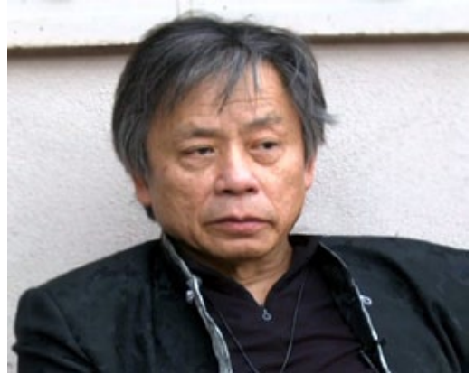
El doctor Kam Yuen.

Con el Método Yuen, la velocidad en experimentar cambios en nuestra salud es inmediata