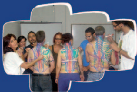
QUIROMASAJE comienzo: 23 de julio