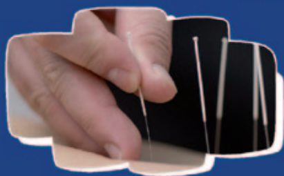
DISECCIÓN Puntos de trayecto de comando comienzo: 22 de julio