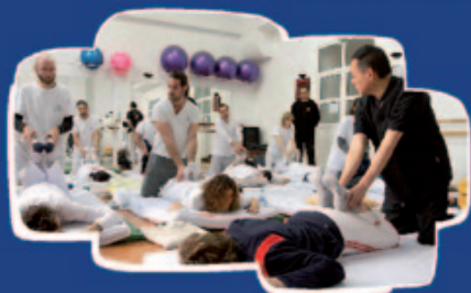
SHIATSU comienzo: 27 de julio