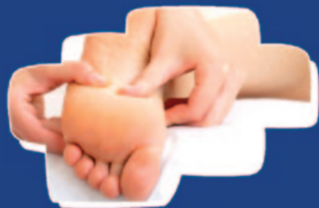
REFLEXOLOGÍA comienzo: 25 de julio