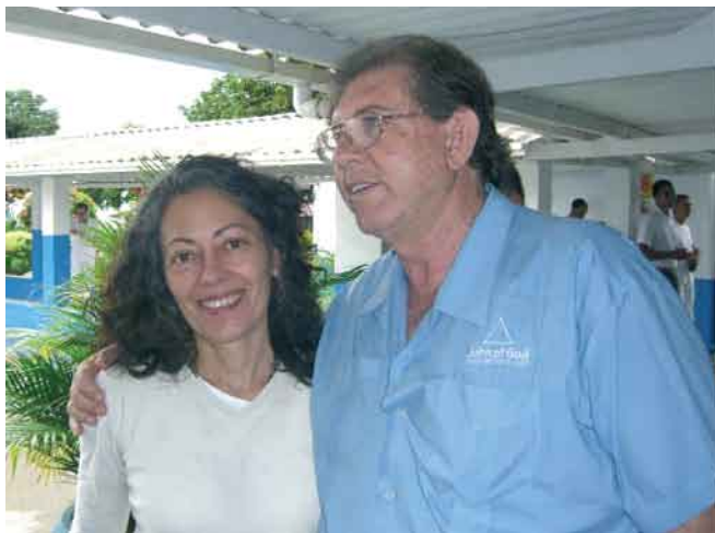
Joao de Deus con la autora de este artículo.

Visita a la Casa de San Ignacio, en el corazón de Brasil, donde acuden gentes de todo el mundo para encontrar alivio en las manos de Juan Teixeira de Faría