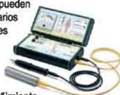
Test de intolerancia alimentaria ELMA rápido, indoloro, no invasivo.